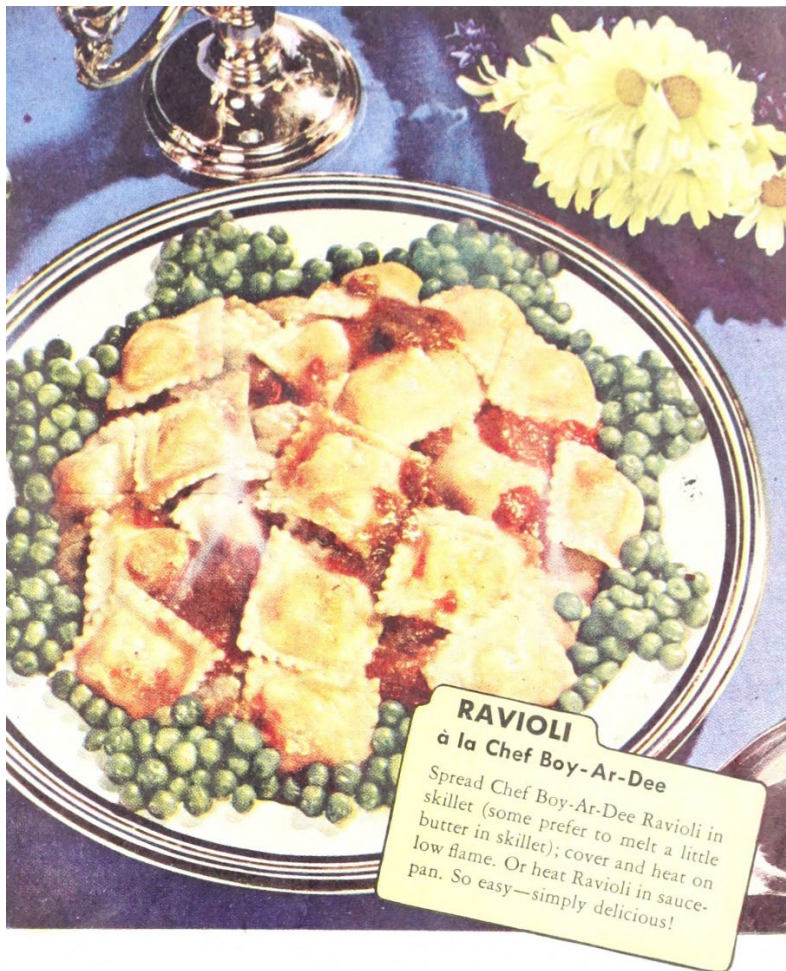
Dosenravioli mit Dosenerbsen.