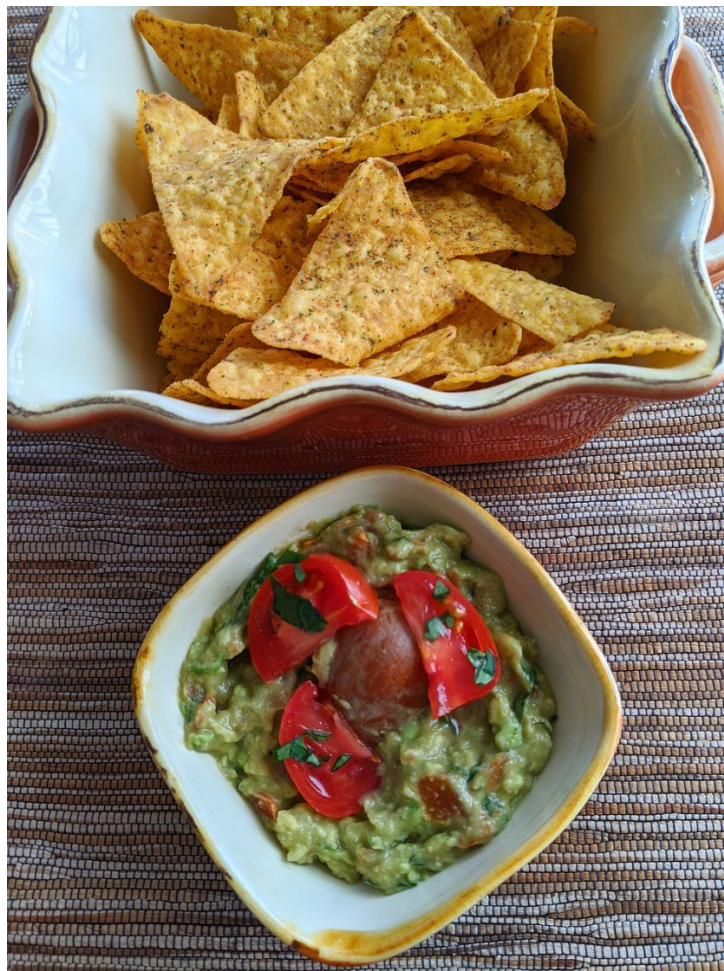
Maischips mit Guacamole.

© 2023 Schulverlag plus AG| Bestandteil von Artikel 90385 Dossier Weitblick NMG 02/2023 – VOM KORN ZUR PASTA