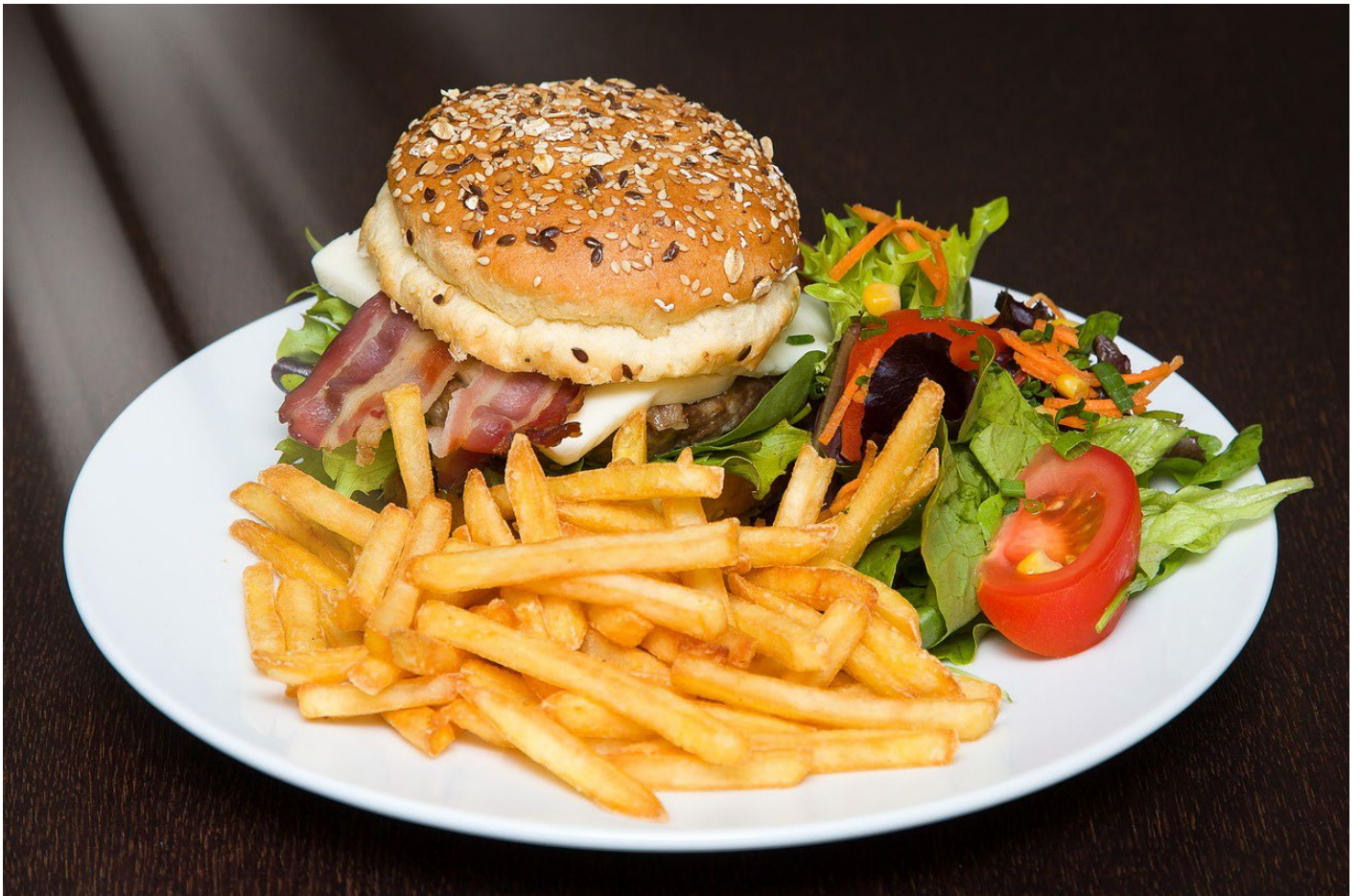
Hamburger mit Pommes frites.

© 2023 Schulverlag plus AG| Bestandteil von Artikel 90385 Dossier Weitblick NMG 02/2023 – VOM KORN ZUR PASTA