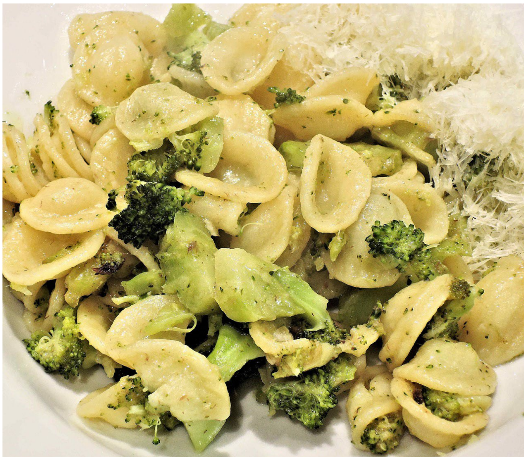
Pasta mit Brokkoli.

© 2023 Schulverlag plus AG| Bestandteil von Artikel 90385 Dossier Weitblick NMG 02/2023 – VOM KORN ZUR PASTA