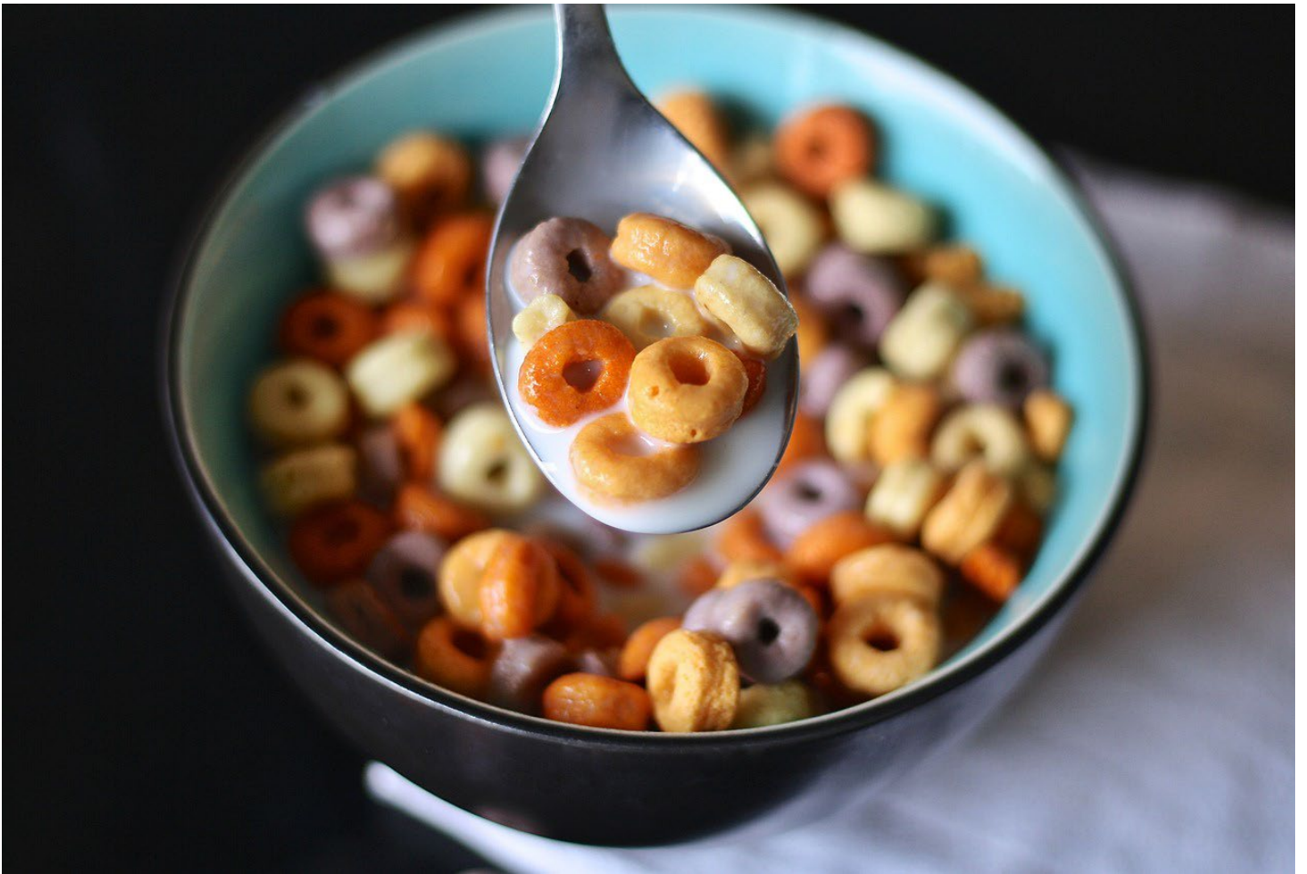
Fruit Loop mit Milch.

© 2023 Schulverlag plus AG| Bestandteil von Artikel 90385 Dossier Weitblick NMG 02/2023 – VOM KORN ZUR PASTA