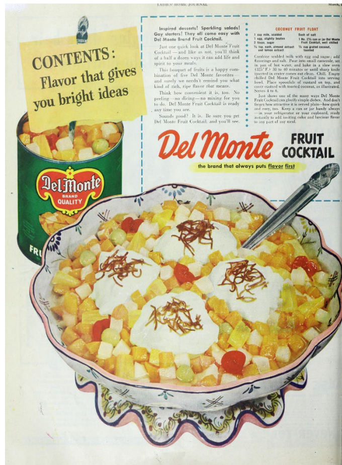
Fruchtsalat aus der Dose.