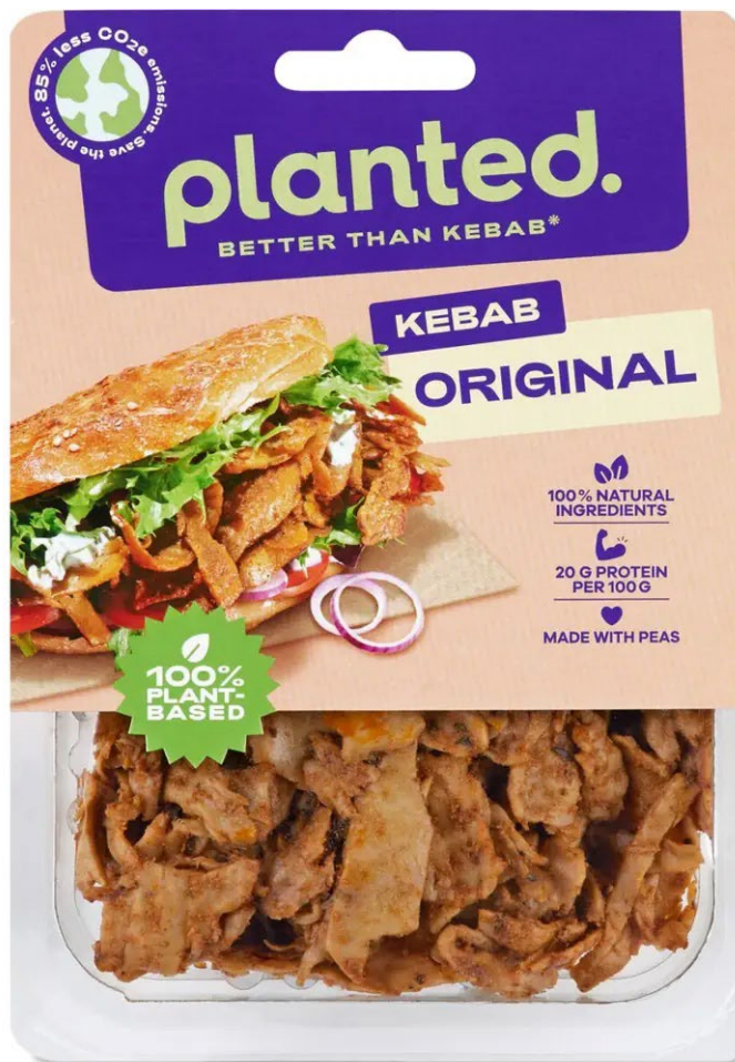
Vegetarisches Kebab als Fertigprodukt.

© 2023 Schulverlag plus AG| Bestandteil von Artikel 90385 Dossier Weitblick NMG 02/2023 – VOM KORN ZUR PASTA