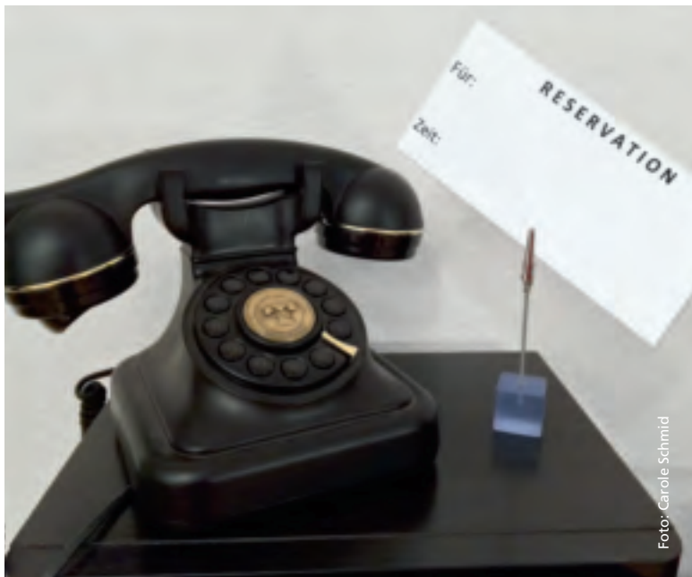
Reservierungen werden auch telefonisch entgegengenommen.