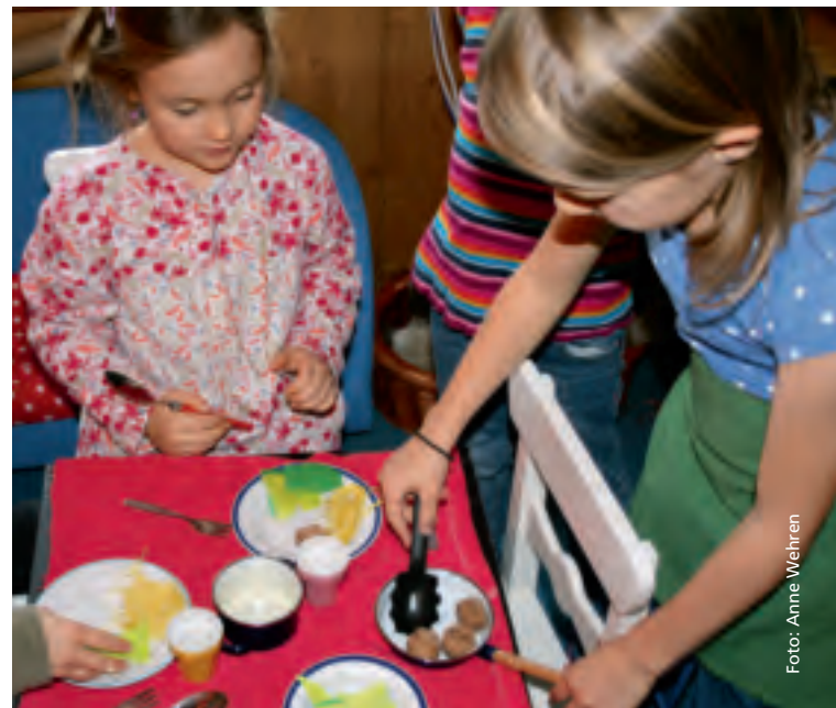
Es ist angerichtet.

noch nicht beherrschen, können mit den bekannten Schreibhilfen zusätzlich unterstützt werden.