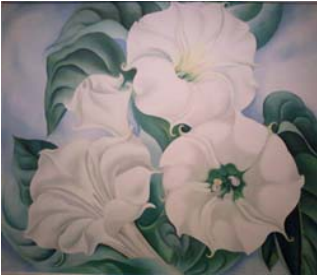
Georgia O'Keeffe: Jimson Weed, 1936 (Jimson Weed, engl.: Gemeiner Stechapfel)