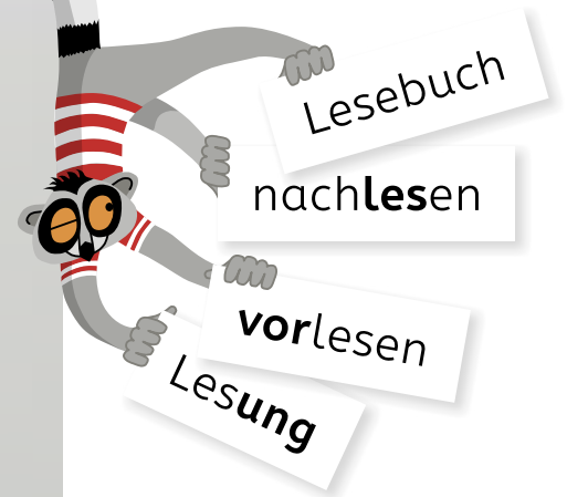
Set Arbeitshefte «Lesen und Schreiben» und «Hören und Sprechen»