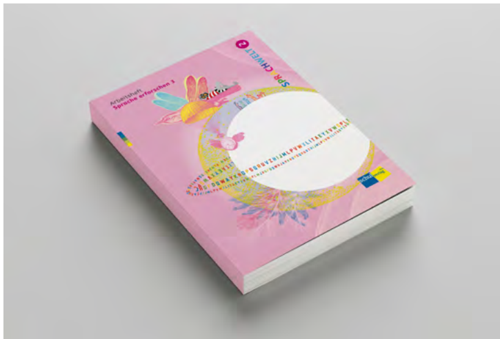
Arbeitsheft «Sprache erforschen 3»