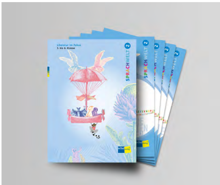
Mappe mit vier Arbeitsheften zu den Lernwelten «Literatur im Fokus»