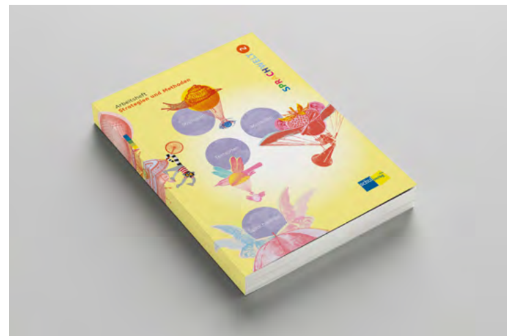
Arbeitsheft «Strategien und Methoden»