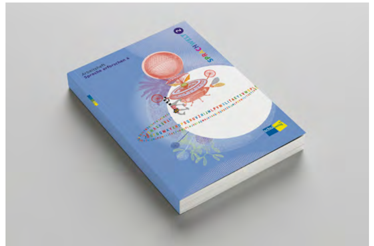
Arbeitsheft «Sprache erforschen 4»